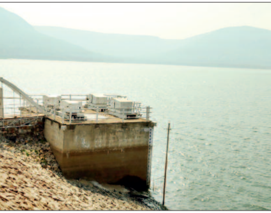
उदंती-सीतानदी: वन्यजीवों का सुरक्षित टिकाना

कारण छत्तीसगढ़ का नियाग्रा कहा जाता है। यहां की प्राकृतिक खूबसूरती हर साल बड़ी संख्या में पर्यटकों को आकर्षित करती है, लेकिन जिले के कई अन्य क्षेत्र अब भी पर्यटन के लिहाज से पूरी तरह विकसित नहीं हो पाए हैं। चुनौतियां और संभावनाएं- पहाड़ियों से घिरे और साल, सरई व बीजा के घने जंगलों से आच्छादित इस क्षेत्र में पक्षियों की विभिन्न प्रजातियों की चहचहाहट भी पर्यावरण को जीवंत