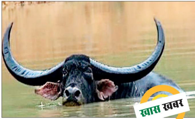
हरिभूमि न्यूज ►► गरियाबंद

कभी नक्सल प्रभावित छवि के लिए पहचाना जाने वाला गरियाबंद जिला अब तेजी से पर्यटन केंद्र के रूप में उभरने की दिशा में बढ़ रहा है। प्राकृतिक सुंदरता, घने जंगल, जलप्रपात और समृद्ध जैव विविधता इस क्षेत्र को नई पहचान दिलाने के लिए तैयार हैं। विशेषज्ञों का मानना है कि यदि शासन-प्रशासन इस दिशा में ठोस कार्ययोजना बनाए, तो यह जिला प्रदेश ही नहीं, देश के प्रमुख इको-टूरिज्म डेस्टिनेशन में शामिल हो सकता है। जिले के प्रमुख पर्यटन स्थलों में सीकासार बांध, तौरंगा बांध और प्रसिद्ध जलप्रपात जतमई, घटारानी तथा बारूका स्थित चिंगरा पगार शामिल हैं। खासतौर पर चिंगरा पगार जलप्रपात को उसकी भव्यता के