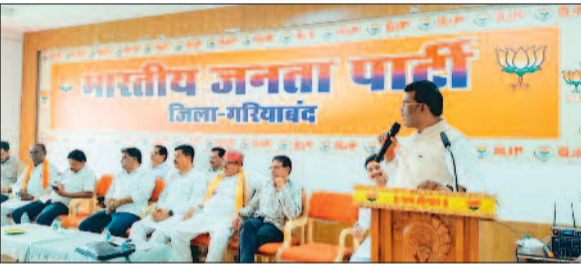
हरिभूमि न्यूज ►► गरियाबंद

भारतीय जनता पार्टी जिला कार्यालय गरियाबंद में स्थापना दिवस के उपलक्ष्य में जिला स्तरीय कार्ययोजना बैठक का आयोजन किया गया। बैठक में संगठन को बूथ स्तर से लेकर जिला स्तर तक और अधिक सशक्त एवं सक्रिय बनाने के उद्देश्य से विस्तृत रणनीति तैयार की गई। इस दौरान जिले के पदाधिकारी, मंडल अध्यक्ष, मोर्चा प्रभारियों सहित बड़ी संख्या में कार्यकर्ता उपस्थित रहे। बैठक में संगठन विस्तार, जनसंपर्क और आगामी कार्यक्रमों को लेकर गहन चर्चा की गई। जिला स्तरीय सक्रिय कार्यकर्ता सम्मेलन आयोजित